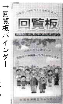
一回覧板バインダー