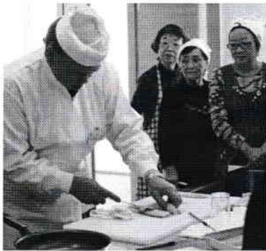
講師の手捌きに感心する受講者

メニューは「スケトウダラの扇揚げ」「カレイのきのこのソース焼き」で、講師が説明する新鮮な魚の見分け方、捌き方に水産基地釧路に住む主婦の皆さんも感心しきりでした。