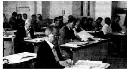
熱心に話を聞く参加者

で取り組くもうとしても個人情報取り扱いの関係もあつて、対象者の把握が難しい。また頂