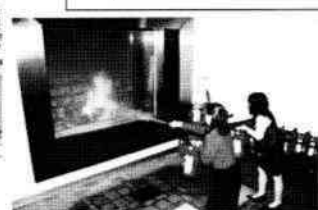
↓初期消火体験の様子