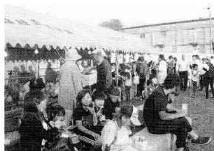
地域の協力があつてまつりが成り立っています。

令和2年は、地区連はじめ各町内会とも緑化・清掃以外の行事・事業は、新型コロナウイルスの影響により実施できなくなり、『まつり』も残念ながら中止になりました。令和3年は、コロナが終息し『まつり』が開催できることを願っています。